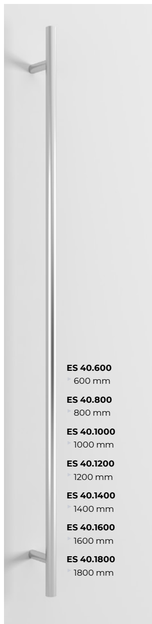
ES 40 Stoßgriff Serie ES 40.600-1800 mit geraden Stützen Edelstahl feinmatt poliert